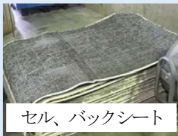
セル、バックシート