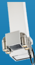
燃料交換機 ホイスト用カメラ