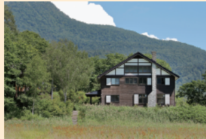
高台に建っているので、湿原を見下ろすような角度で見られます。