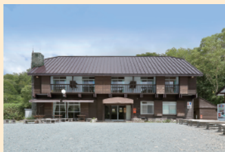
鳩待山荘では、宿泊と日帰り入浴ができます。休憩所では、お土産も充実！

至仏山荘 至仏休憩所 軽食をご用意あります。尾瀬名物の花豆ソフトクリームをぜひ！