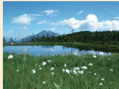
天上の楽園と称えられるアヤメ平からは、湿原越しに尾瀬や周辺の山々を眺めることができます。