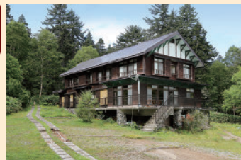
朝焼け、夕焼けに染まる尾瀬沼と燧ヶ岳をのぞむ、静かな湖畔の山小屋。