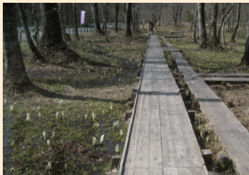
大清水湿原 尾瀬では一番早く、ゴールデンウィークの頃には水芭蕉が咲きます。