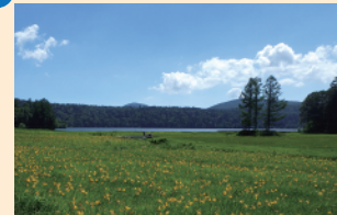
大江湿原 7月下旬頃には、見渡す限りニッコウキスゲの黄色い花で敷き詰められます。