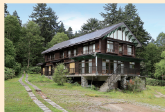
朝焼け、夕焼けに染まる尾瀬沼と燧ヶ岳をのぞむ、静かな湖畔の山小屋。