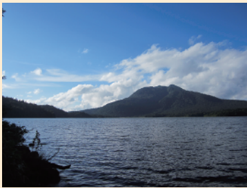
尾瀬沼から見た燧ヶ岳は圧巻です。また、周辺には季節ごとに様々な花に出会えます！