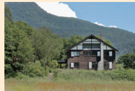
高台に建っているので、湿原を見下ろすような角度で見られます。