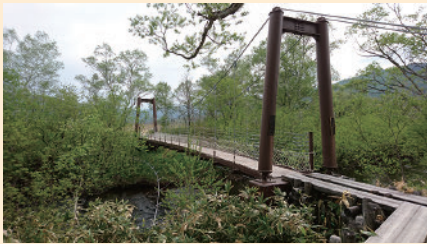
ヨッピー川にかかる尾瀬ヶ原唯一のつり橋です。