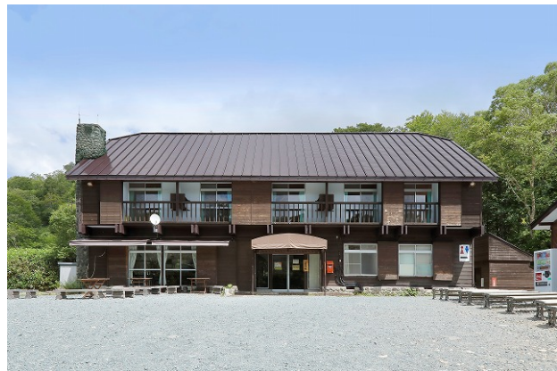
鳩待山荘 (山荘前広場側より)