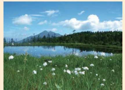
天上の楽園と称えられるアヤマメ平からは、湿原越しに尾瀬や周辺の山々を眺めることができます。