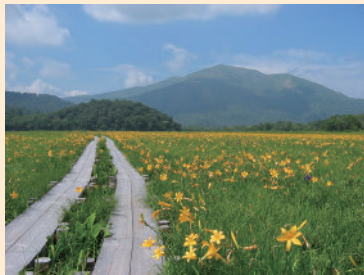
尾瀬の主要スポットの尾瀬ヶ原。大自然の美しい景色が広がっています。絶景のフォトスポットです。

2日目に天上の楽園といわれるアヤマメ平を楽しむコースです。アヤマメ平への道も木道中心の歩きやすい山道となっていますので、気軽に天上からの素晴らしい眺めを楽しむことができます。