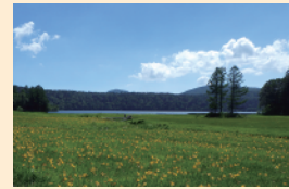
大江湿原 7月下旬頃には、見渡す限り ニッコウキスゲの黄色い花 で敷き詰められます。