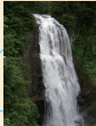
三条の滝 高低差130mの 豪快な滝です。