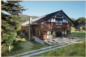
元湯山荘は尾瀬で温泉入浴が体験できる山荘です。